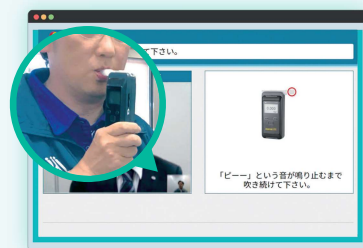
操作案内に従いアルコール測定