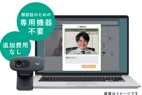
画像はイメージです

※ご利用には別途お申し込みが必要となります。詳しくは弊社営業までお問い合わせください。