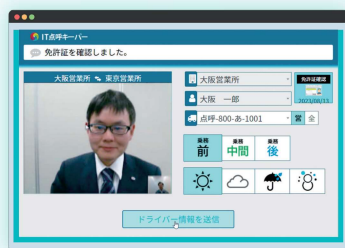
直感的に操作できるシンプルなボタン

案内に従って操作を行うだけで、アルコール測定を含む点呼が簡単に実施可能です。大きなボタンと分かりやすい画面設計のため、パソコン操作に不慣れな方でも安心してお使いいただけます。